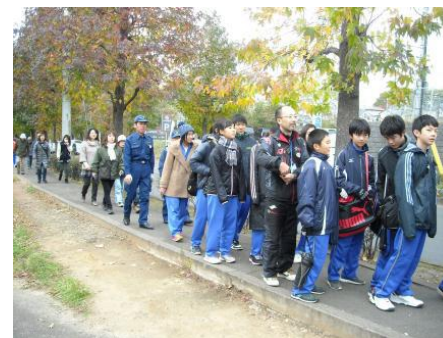
集団避難・誘導訓練

その他:平成27年1月に仙台市で行われた国連防災会議のジュニアカンファレンスにおいて、南吉成中学校の生徒が活動内容の発表を行った。