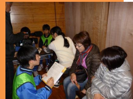
避難所での聞き取り調査を想定した訓練