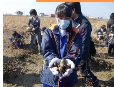
津波被災農家で、生徒と保護者が綿花の収穫体験を行った